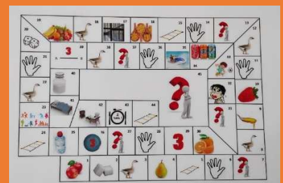
Plaquette utilisée pour le jeu de l'oie

L'intervention menée par la diététicienne, a été très bien reçue par les participants et les 3 autres groupes bénéficieront prochainement de cette séance.