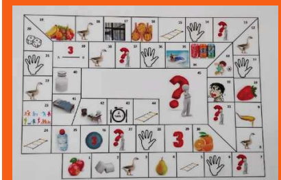
Plaquette utilisée pour le jeu de l'oie

L'intervention menée par la diététicienne, a été très bien reçue par les participants et les 3 autres groupes bénéficieront prochainement de cette séance.